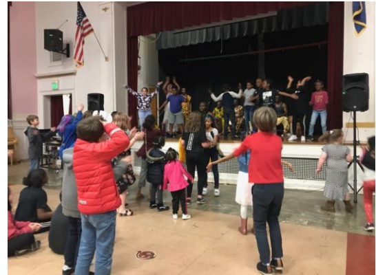
Black History Month Celebration