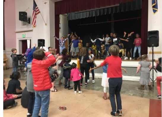
Celebración del Mes de la Historia Afro-Americana